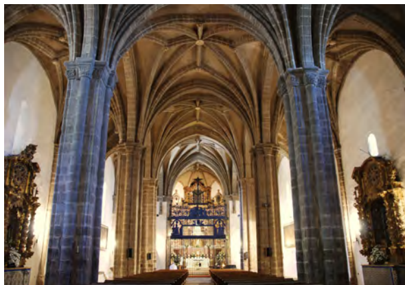
(Interior Iglesia Ntra. Sra. del Mayor Dolor)