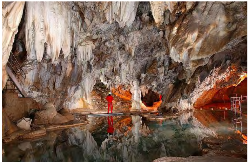
(Lago de la Sultana)