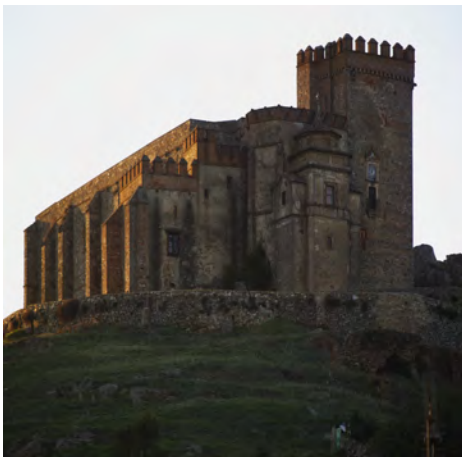
(Iglesia Ntra. Sra. del Mayor Dolor)

Es el templo más antiguo y emblemático de Aracena. Fue construida entre los siglos XIII y XV en el recinto fortificado del Castillo. Es un edificio de estilo gótico, donde destaca la torre exterior, de estilo mudéjar, decorada con paños de sebka.