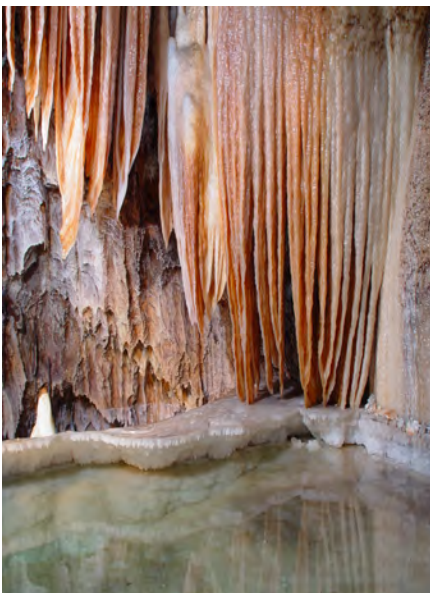
(Marmita de los gigantes)

La Gruta de las Maravillas presenta tres niveles de galerías superpuestas, una longitud conocida de 2.130 metros, siendo visitables unos 1.200 metros, que con motivo del centenario se ha ampliado este año, habilitando dos nuevas galerías "Los Banquetes" y "La Palmatoria."